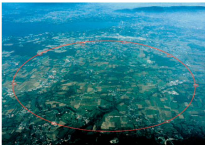
Bild 1: Herzstück der CERN-Experimente ist ein 27 Kilometer langer kreisförmiger Tunnel 100 Meter unterhalb der Erdoberfläche, in dem sich ein Teilchenbeschleuniger der Superlative befindet. Im neuen Protonen Speicherring LHC (Large Hadron Collider) prallen Teilchen in 10 mal höheren Geschwindigkeiten aufeinander als in früheren Beschleunigern.

Das Konzept dieser Vorlagen und Instanzen wird auch auf grafische Objekte (Anlagenbilder) angewendet. Parametrisierte Anlagenbilder können durch Substituierung aktueller Werte zur Laufzeit instanziiert werden. Dadurch ist es möglich, ein einzelnes generisches Grafikobjekt gleich welcher Komplexität ein-